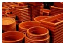
MACETAS Y JARDINERAS TERRACOTA